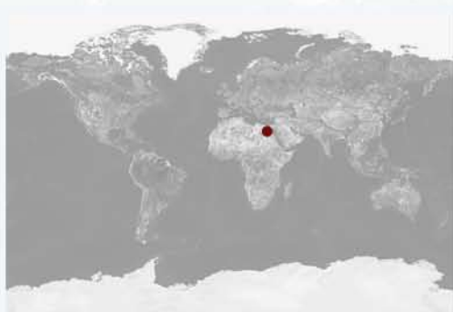
Le Caire, Egypte

Avec 11 millions d'habitants, la capitale de l'Égypte est une des plus grandes mégapoles du monde. Au cours des années 90, la superficie bâtie du Caire a doublé malgré un ralentissement de la croissance démographique de la métropole (1,9% par an contre 2,1% pour l'Égypte).